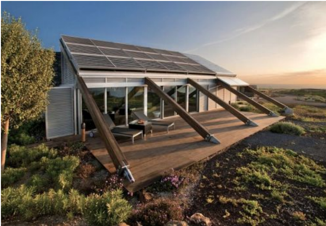
Αρχές Βιοκλιματικού Σχεδιασμού

Η βιοκλιματική αρχιτεκτονική αφορά στο σχεδιασμό κτιρίων και χώρων (εσωτερικών και εξωτερικών-υπαίθριων) με βάση το τοπικό κλίμα, με σκοπό την εξασφάλιση συνθηκών θερμικής και οπτικής άνεσης, αλλά και την εξοικονόμηση σε ενέργεια για θέρμανση και ψύξη , αξιοποιώντας την ηλιακή ενέργεια και άλλες περιβαλλοντικές πηγές όπως οι ανανεώσιμες πηγές ενέργειας, αλλά και τα φυσικά φαινόμενα του κλίματος.